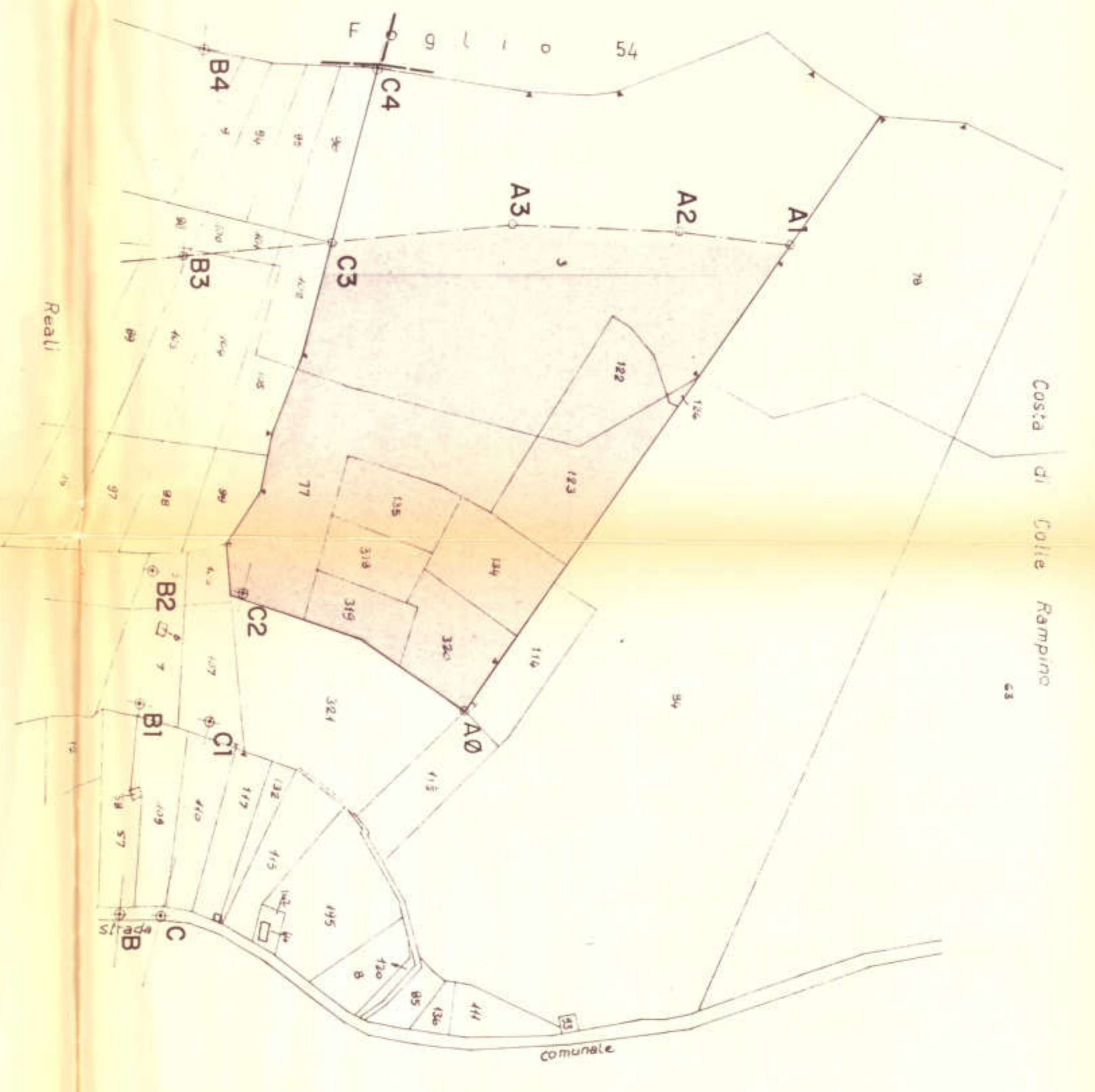
STRALCIO AEROFOTOGRAFOMETRICO I:5000 Fg. 3