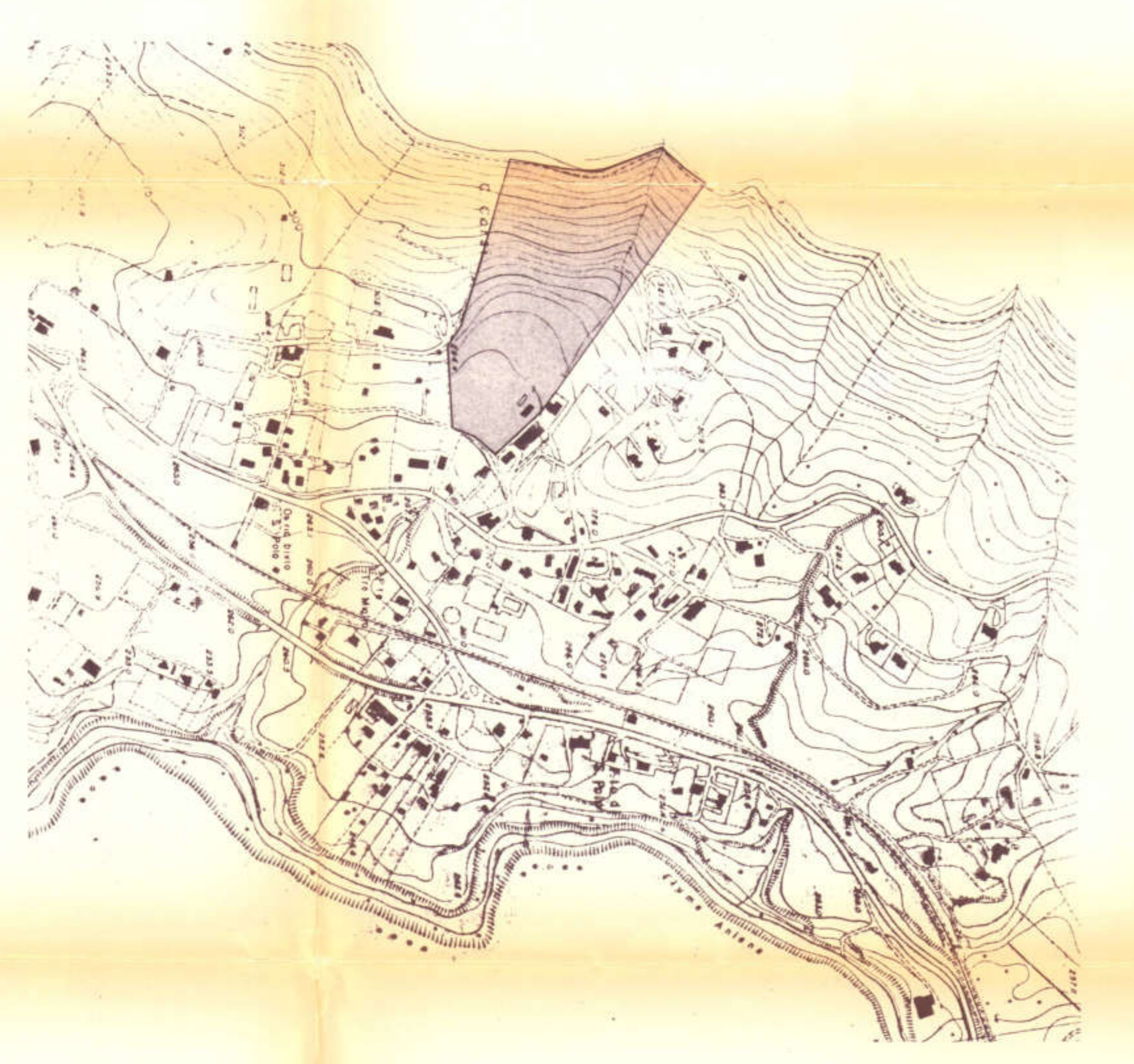
STRALCIO AEROFOTOGRAFOMETRICO I:5000 Fg. 3