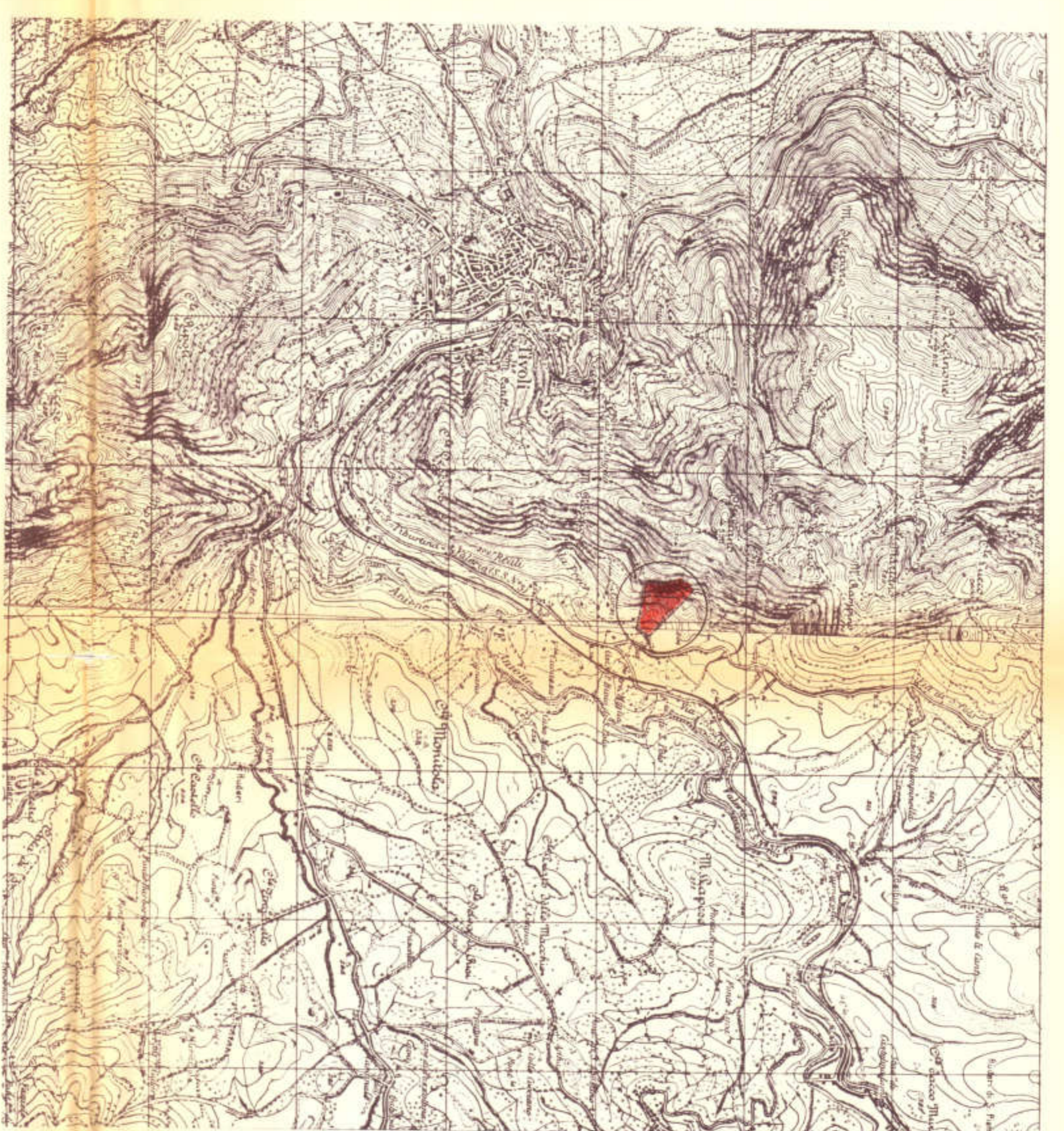
STRALCIO I.G.M. I:25000